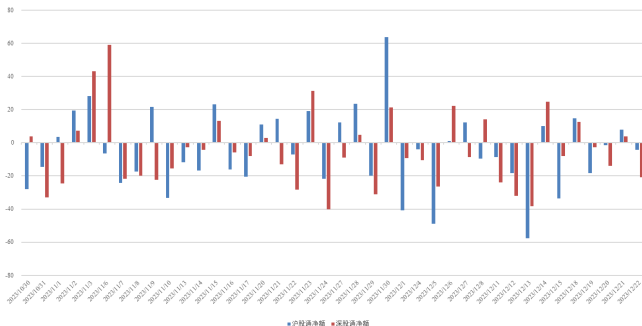
图 3：近四十个交易日沪股通、深股通资金流向

北向资金净流出，周内累计净流出金额 22.36 亿。具体来看，沪股通资金净卖出 1.34 亿，深股通资金净卖出 21.02 亿。