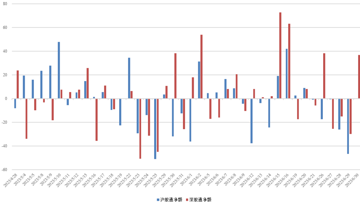
图 3：近四十个交易日沪股通、深股通资金流向

北向资金净流出，周内累计净流出金额 84.81 亿。具体来看，沪股通资金净卖出 90.22 亿，深股通资金净买入 5.41 亿。