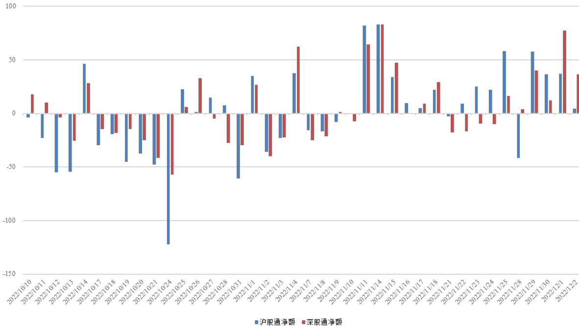
图 3：近四十个交易日沪股通、深股通资金流向

北向资金净流入，周内累计净流入金额 265.07 亿。具体来看，沪股通资金净买入 94.25 亿，深股通资金净卖出 170.82 亿。