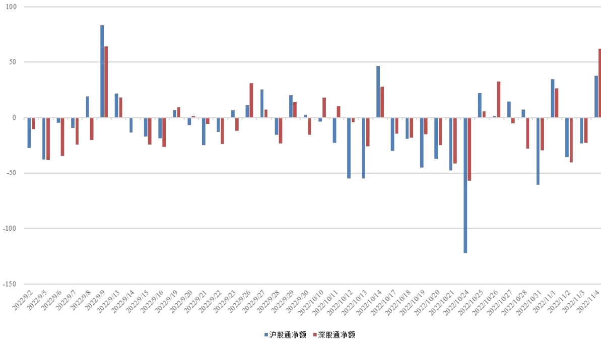
图 3：近四十个交易日沪股通、深股通资金流向

北向资金净流出，周内累计净流出金额 50.11 亿。具体来看，沪股通资金净卖出 46.72 亿，深股通资金净卖出 3.39 亿。