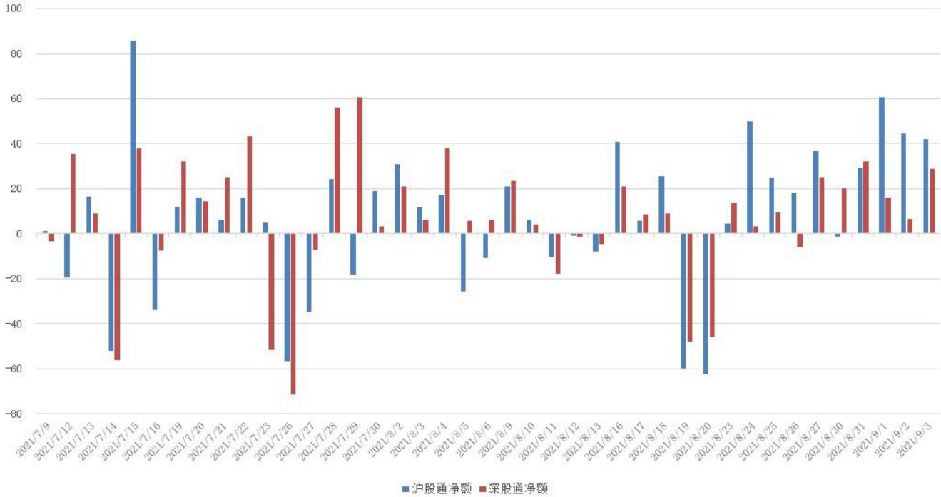
图 3：近四十个交易日沪股通、深股通资金流向

北向资金净流入，周内累计金额 297.27 亿。具体来看，沪股通资金净买入 175.42 亿，深股通资金净买入 103.85 亿。