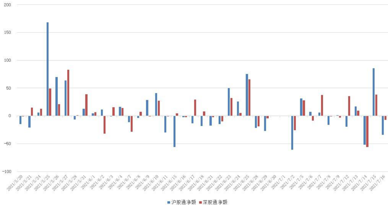
图 3：近四十个交易日沪股通、深股通资金流向

北向资金净小幅流入，周内累计金额 16.69 亿。具体来看，沪股通资金净卖出 2.44 亿，深股通资金净买入 19.13 亿。