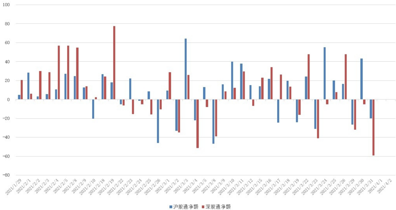
图 3：近四十个交易日沪股通、深股通资金流向

上周因复活节假期原因，陆股通业务暂停两日，周内三个交易日北向资金转为净流出，累计净流出金额 99.38 亿。具体来看，沪股通资金净卖出 3.16 亿，深股通资金净卖出 96.23 亿。