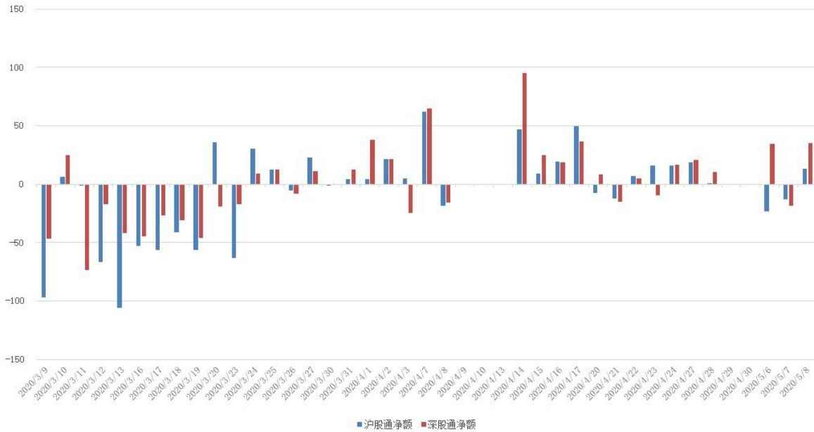
图 3：近四十个交易日沪股通、深股通资金流向

上周北向资金持续小幅净流入，累计金额为 28.57 亿，较节前一周有所下降，但沪股通及深股通资金流向出现分化。具体来看，沪股通资金净卖出 23.14 亿，深股通资金净买入 51.71 亿。