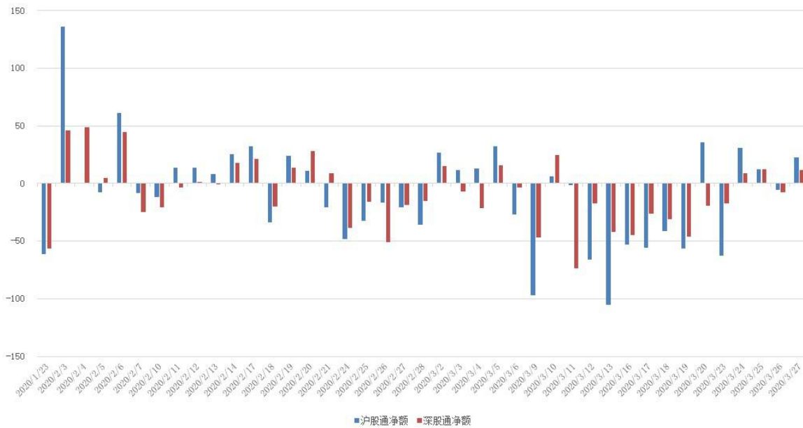
图 3：近四十个交易日沪股通、深股通资金流向