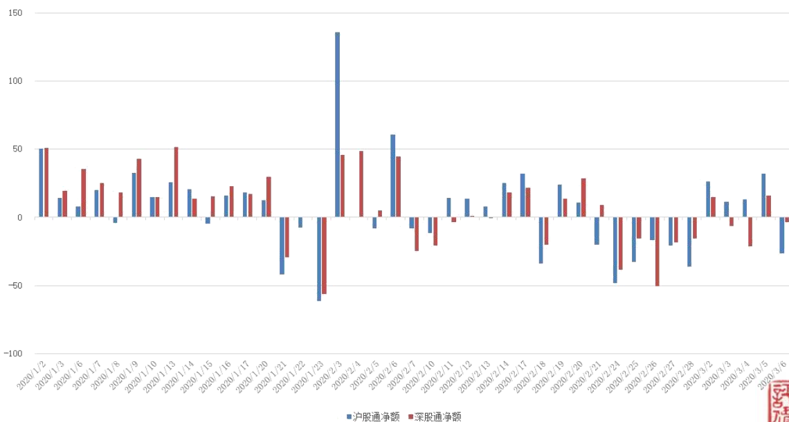
图 3：近四十个交易日沪股通、深股通资金流向

上周沪股通、深股通合计净流入，整周累计流入金额为 56.20 亿。具体来看，上周沪股通资金净买入 56.74 亿，深股通资金净卖出 0.53 亿。