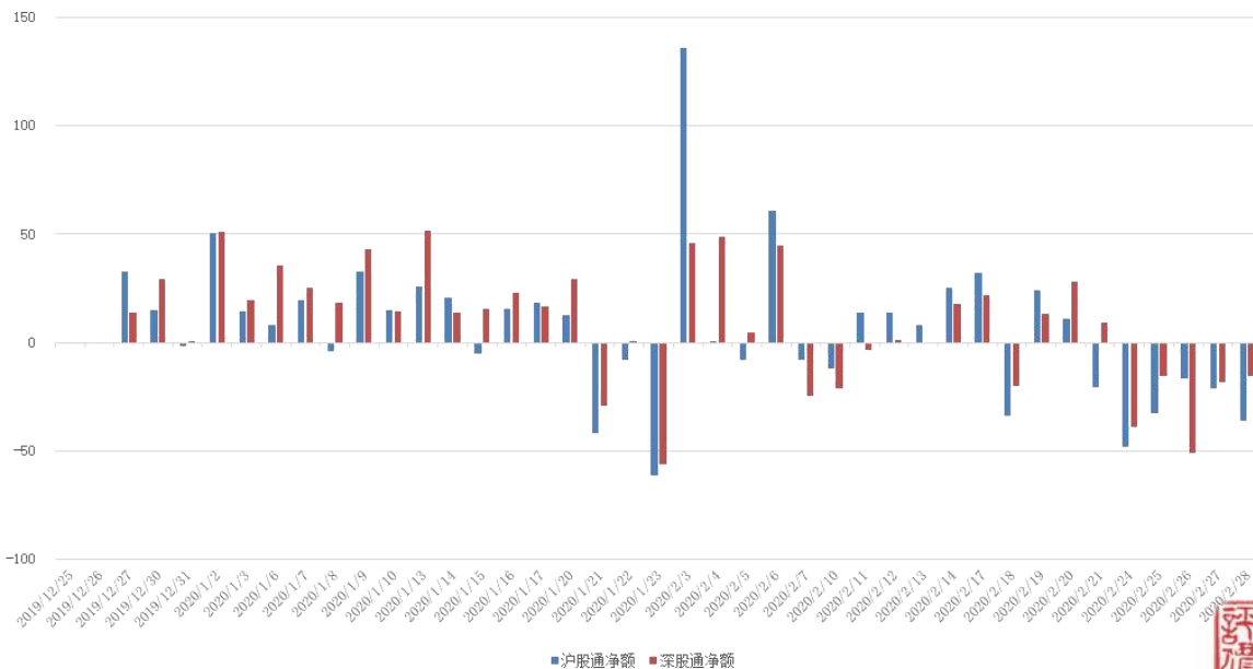
图 3：近四十个交易日沪股通、深股通资金流向

上周沪股通、深股通合计净额转为净流出，整周累计金额为 293.41 亿。具体来看，上周沪股通资金净卖出 154.44 亿，深股通资金净卖出 138.96 亿。