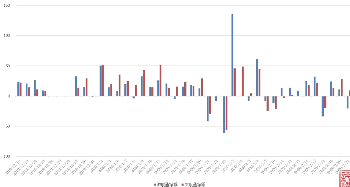
图 3：近四十个交易日沪股通、深股通资金流向

上周沪股通、深股通合计净额保持净流入，整周累计净流入资金 64.94 亿。具体来看，上周沪股通资金净买入 12.30 亿，深股通资金净卖出 52.64 亿。