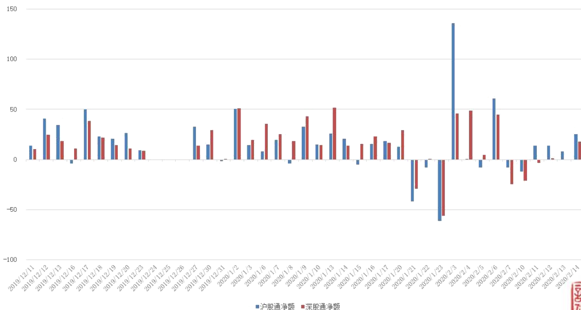
图 3：近四十个交易日沪股通、深股通资金流向

上周沪股通、深股通合计净额保持净流入，整周累计净流入资金 43.70 亿。具体来看，上周沪股通资金净买入 49.19 亿，深股通资金净卖出 5.49 亿。